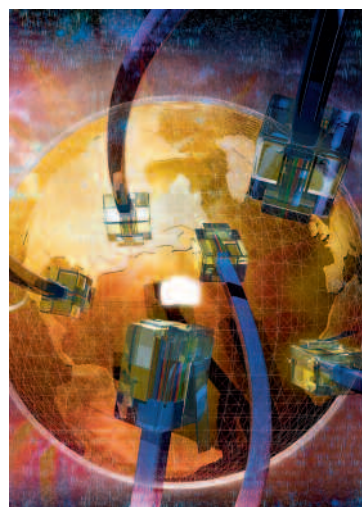
92 Next Generation Network Access Technology: Integration total