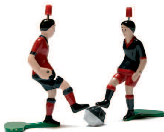
54 Ganzheitliches Performance Management und Business Intelligence: Flexibler Spielplan