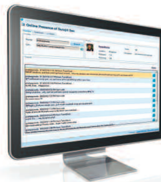
64 Kundenmanagement und CRM im Zeitalter der sozialen Netze: In fünf Schritten zum Social CRM