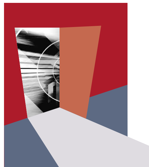
72 Business Integration Portale: Rahmen für virtuelle Geschäftsmodelle