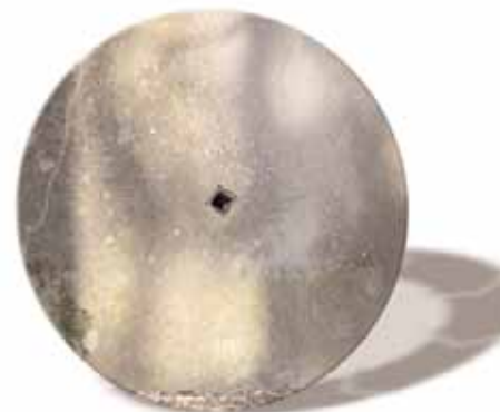
56 IT-Prozesse: Das Rad nicht immer neu erfinden