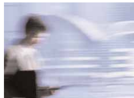
92 Mobile IT – Unwired Enterprise: Die Informationsbarrieren einreißen