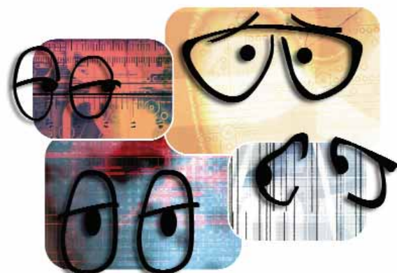
58 Web- und Videokonferenzen: Da guckst du!