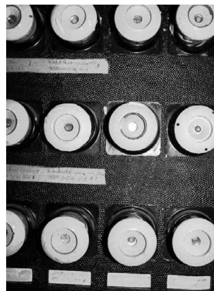
36 Business Intelligence ganzheitlich sehen und implementieren: BI-Governance ist Marathon